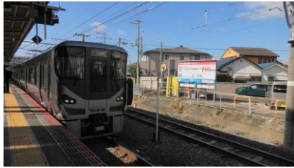
関空・紀州路快速で 大阪駅へ向かいます