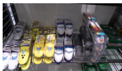
ドクターイエロー 0系新幹線・N700A系新幹線