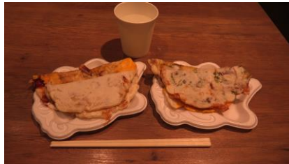
左手前：いか焼き・左奥：デラバン 右手前：ネギいか焼き 右奥：和風デラ

https://catalog.hankyu-hanshin-dept.co.jp/hankyu/brand/index.html?bd=hsb_ikayaki&cp=snack15&btm=0&utm_source=hshontenhp&utm_medium=storemedia& bdsid=38~ZS4.pOt5e+f.1772168007163.1772168436& bd_prev_page=https%3A%2F%2Fwww.hanshin-dept.jp%2Fhshonten%2Frestaurantguide%2Fsnackpark%2Findex.html& bdrpf=1