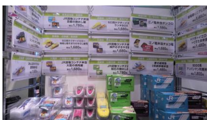
コンテナ弁当・アンパンマン列車 ハローキティ新幹線