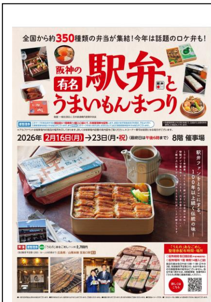
パンフレットの表紙