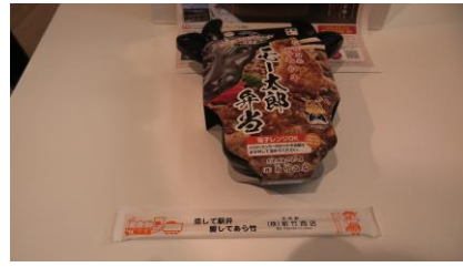
昨年箸袋が新しくなりました。