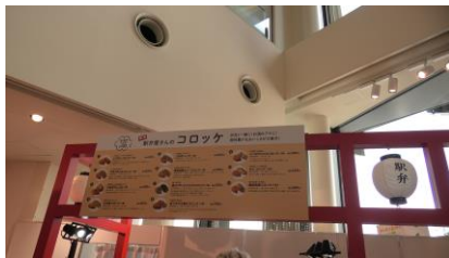
駅弁屋さんのコロッケ

ただいま輸送駅弁コーナーに入るために列に並んでいるところですが、途中で気になるものを見つけました。